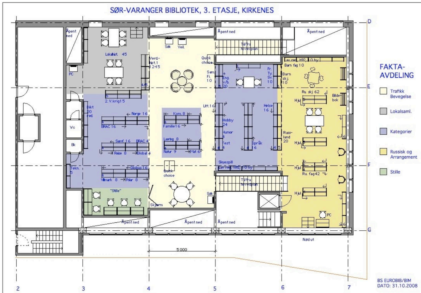
Skisse 3. etasje Sør-Varanger bibliotek