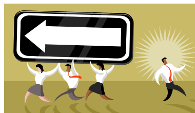
Felles retning for godt skolemiljø

Utdanningsdirektoratet har utarbeidet en veileder til ansatte og ledere i grunnskolen i arbeidet mot mobbing .