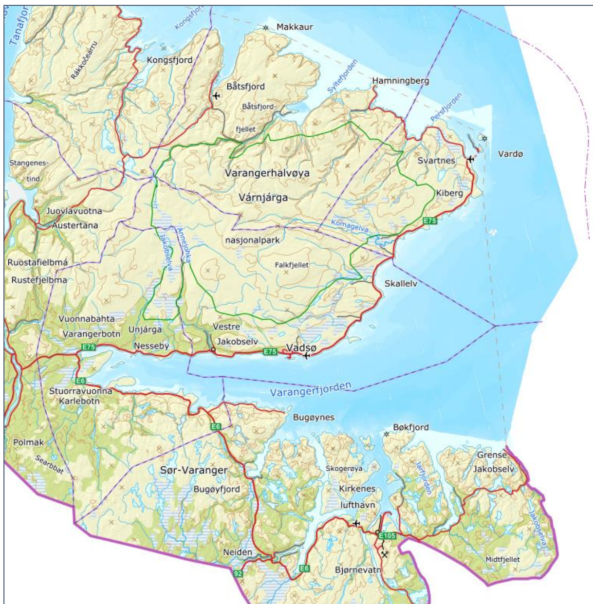
Figur 1. Oversiktskart Varanger.

Dette dokumentet er planprogram for interkommunal kystsoneplan for Varanger . Dokumentet skal gi oversikt over planprosessen som nå igangsettes, med søkelys på innhold, utredninger og deltakere. Hensikten er å styrke medvirkningen i den innledende fasen av planutarbeidelsen.