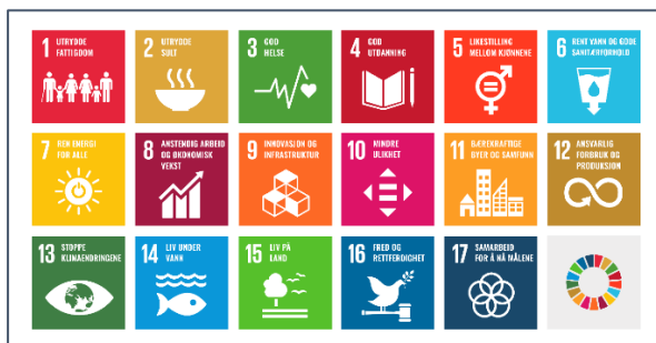
Figur 2. FNs bærekraftsmål er verdens felles arbeidsplan fordelt over 17 målområder for å utrydde fattigdom, bekjempe ulikhet og stoppe klimaendringene innen 2030.

Regjeringen har bestemt at FNs 17 bærekraftsmål, som Norge har sluttet seg til, skal være det politiske hovedsporet for å ta tak i vår tids største utfordringer, også i Norge. Det er derfor viktig at bærekraftmålene blir en del av grunnlaget for samfunns- og arealplanleggingen. Våren 2020 ble det klart at regjeringen skal lage en nasjonal handlingsplan for målene. Dette er viktig fordi de 17 bærekraftmålene henger tett sammen. Det er også nødvendig med en god plan for hvordan målene kan oppnås på tvers av politiske skillelinjer og i samarbeid med organisasjoner og kommuner.