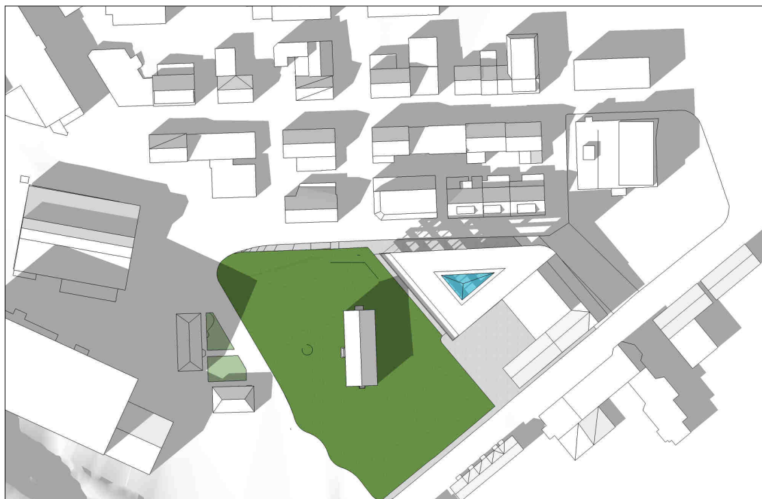
kl 1500 21 april