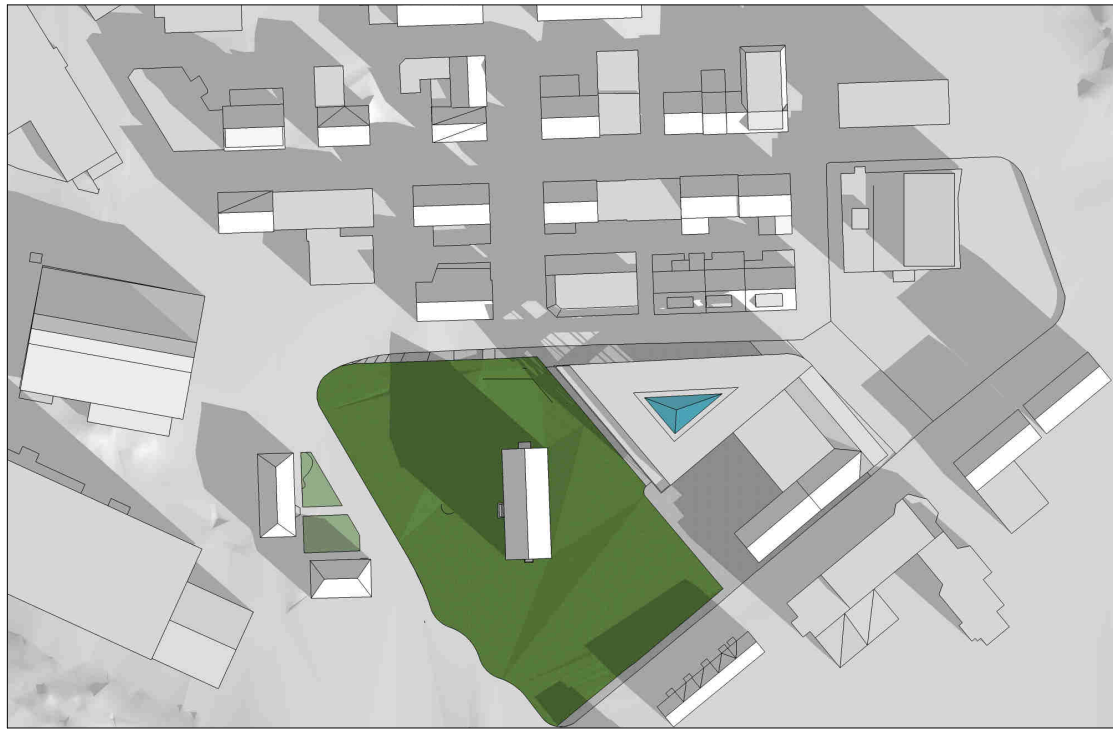
kl 0900 21 mars