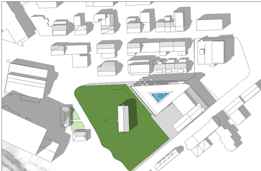
kl 1500 21 juni