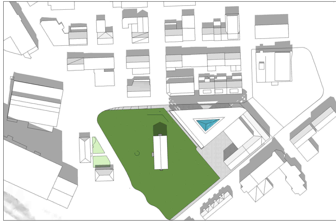
kl 1200 21 juni