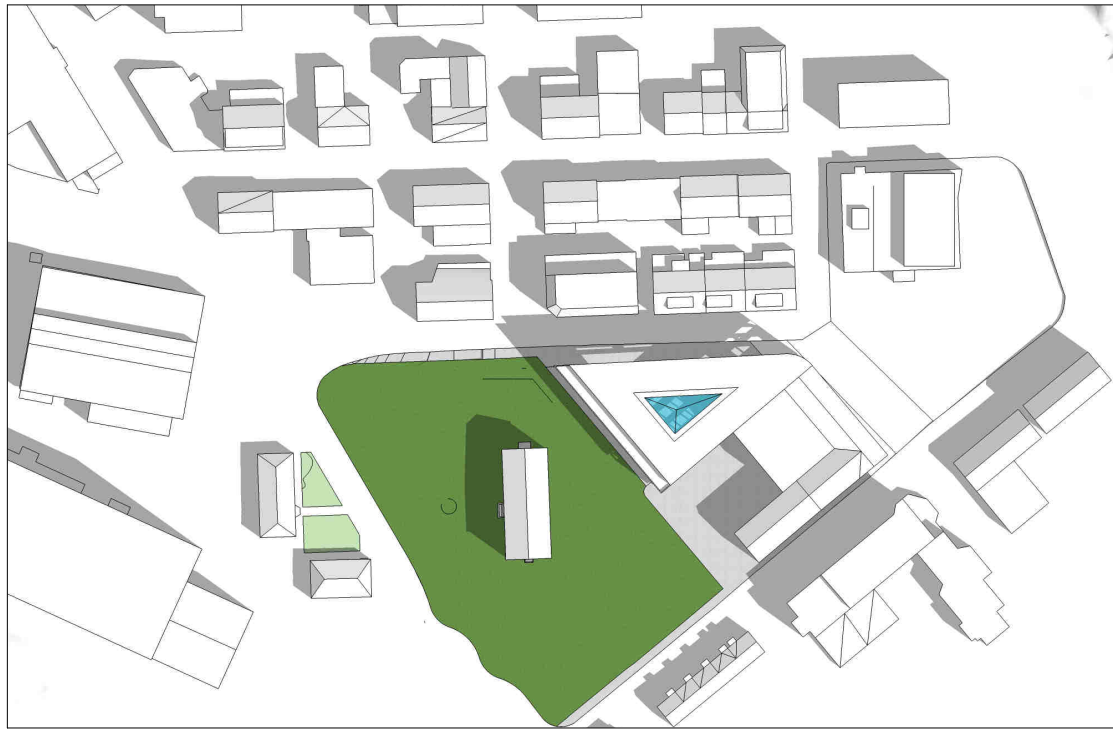
kl 0900 21 juni