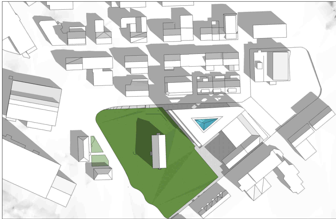
kl 0900 21 april