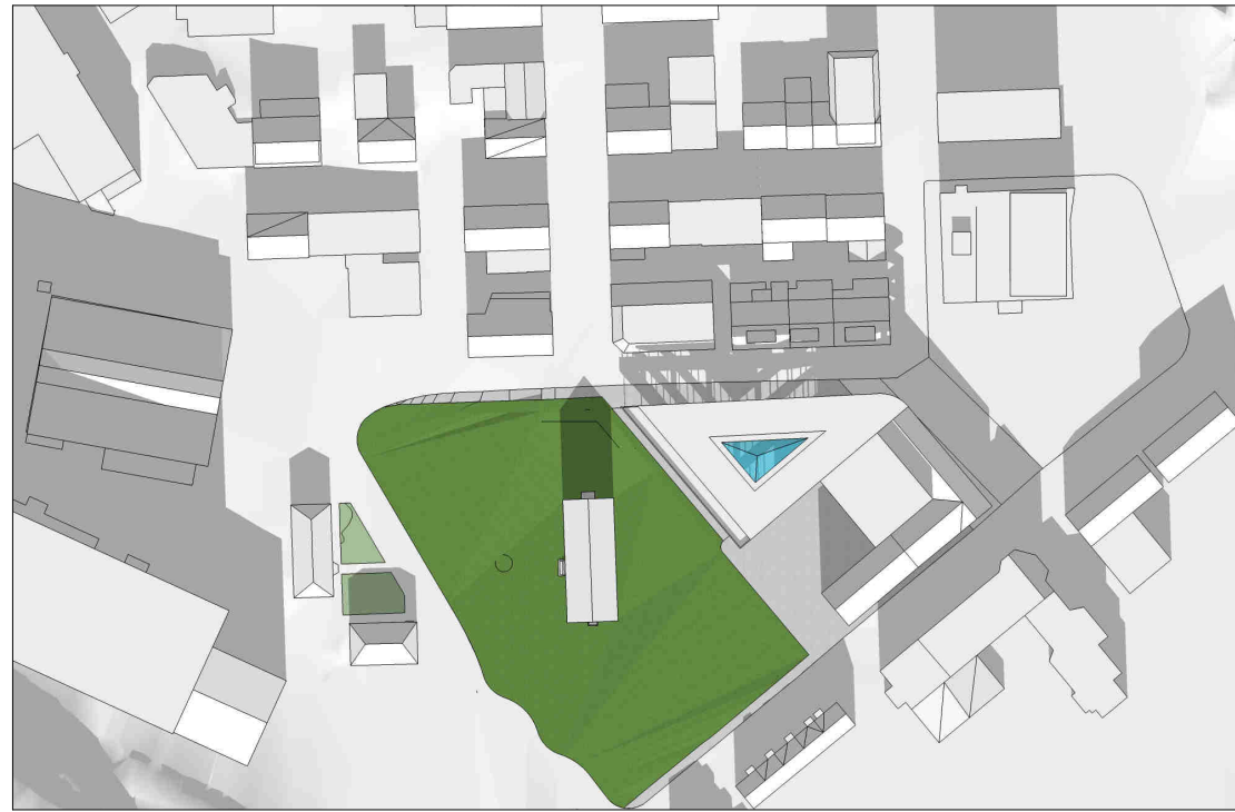
kl 1200 21 mars