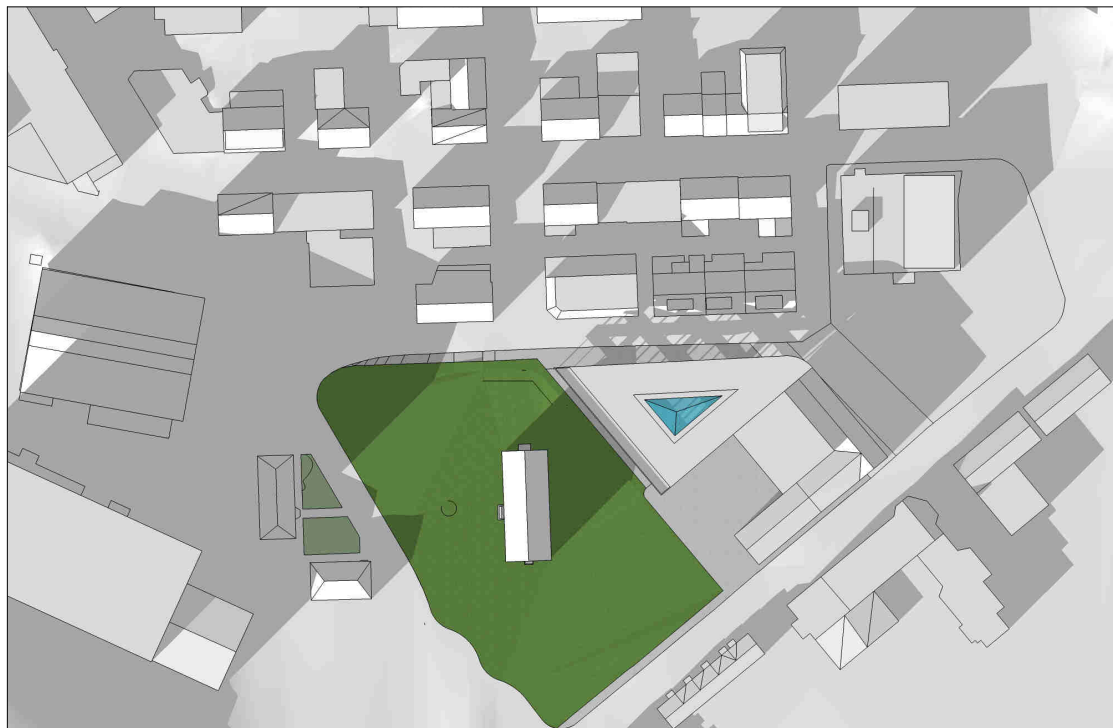
kl 1500 21 mars