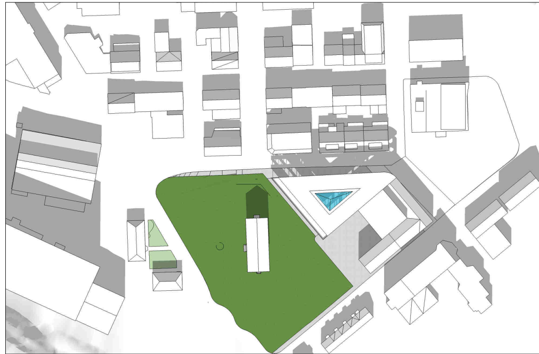
kl 1200 21 april