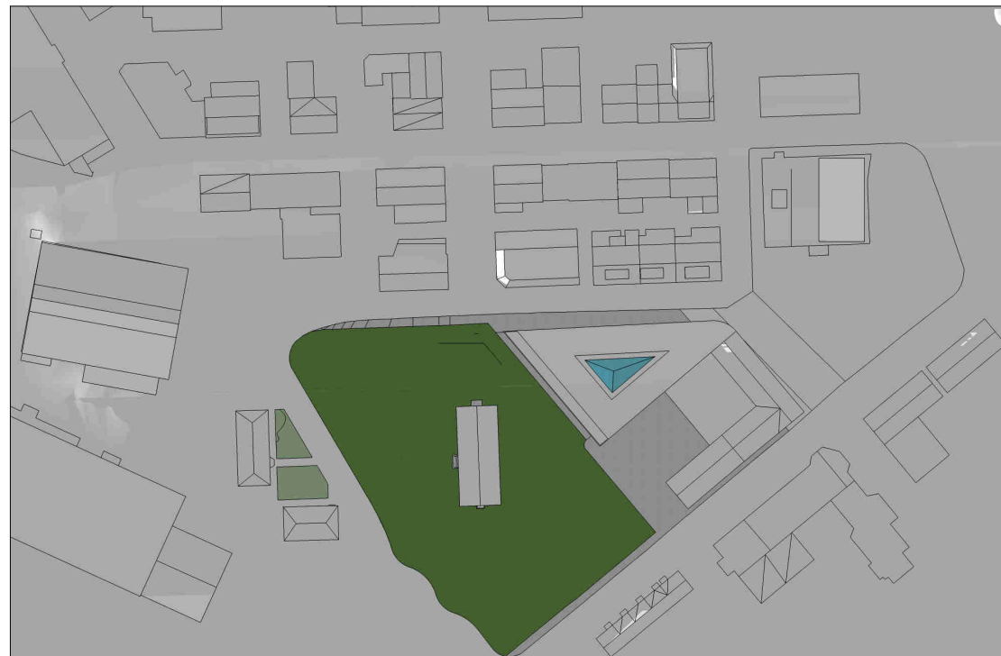
kl 1800 21 mars