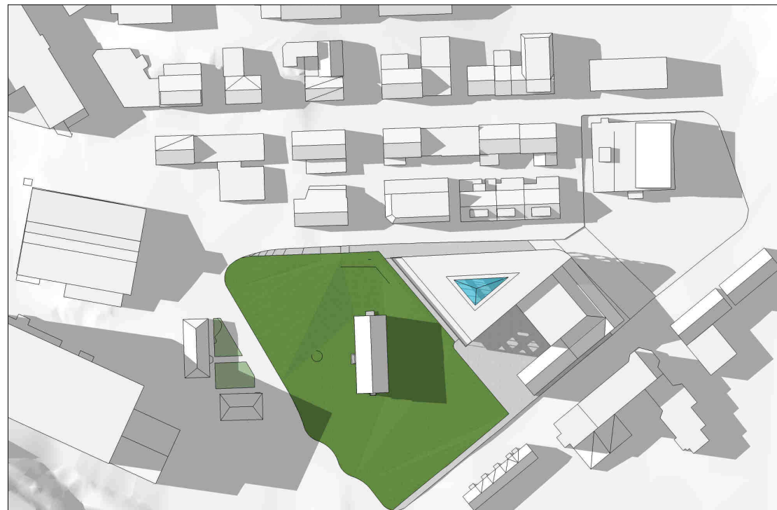
kl 1800 21 juni