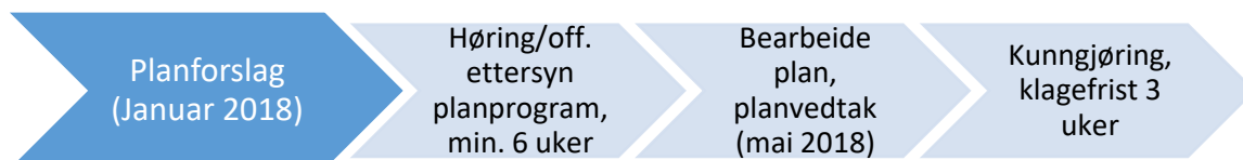
Figur 1: planprosess for kommunedelplan.

Den 28.11. 2016 vedtok utvalg for levekår en prosessplan for strategisk oppvekstplan. Det er nå utarbeidet et forslag til planprogram for oppvekstplanen. Planprogrammet skisserer tema og fremdrift for prosessen frem til en helhetlig oppvekstplan for Sør-Varanger kommune. Det er en stor og omfattende prosess som